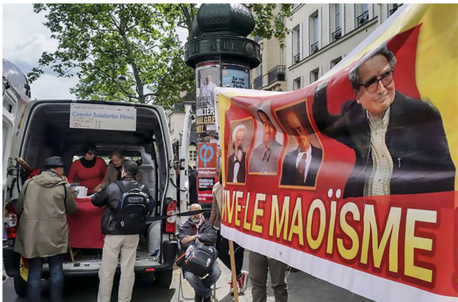
Maoístas exigen amnistía general para ‘prisioneros políticos’: fermez la prison militaire de la Base Naval du Callao.