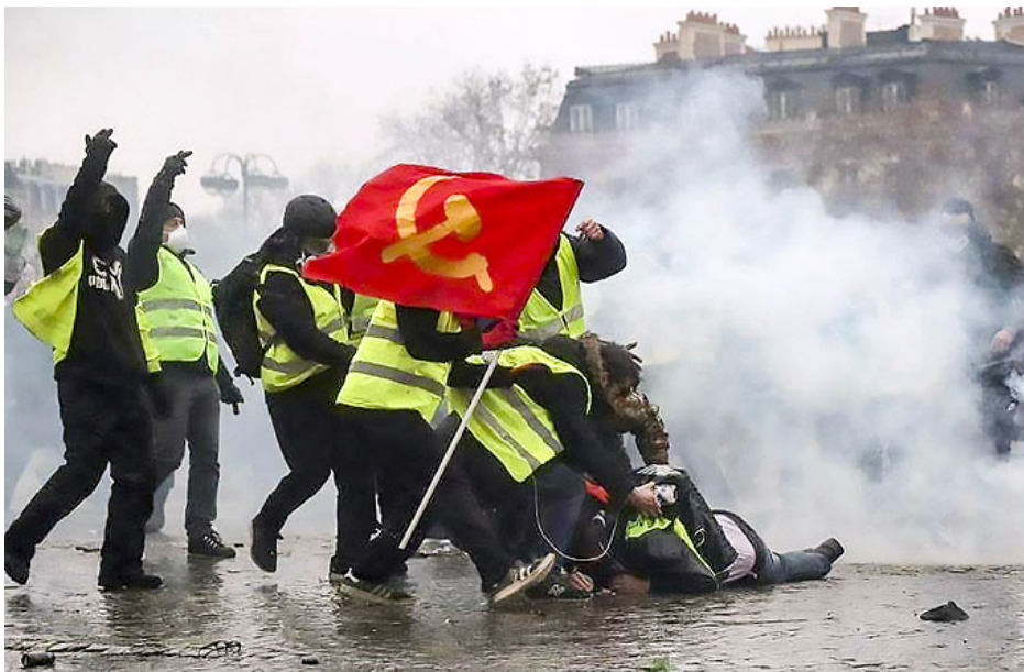
Parlamento francés aprobó polémica ley antivandalismo para frenar a ‘chalecos amarillos’ que protestan desde el 17 de noviembre

“Mientras el maoísmo apoya a los ‘chalecos amarillos’, pro senderistas venden el nuevo libro de Abimael Guzmán en Francia”