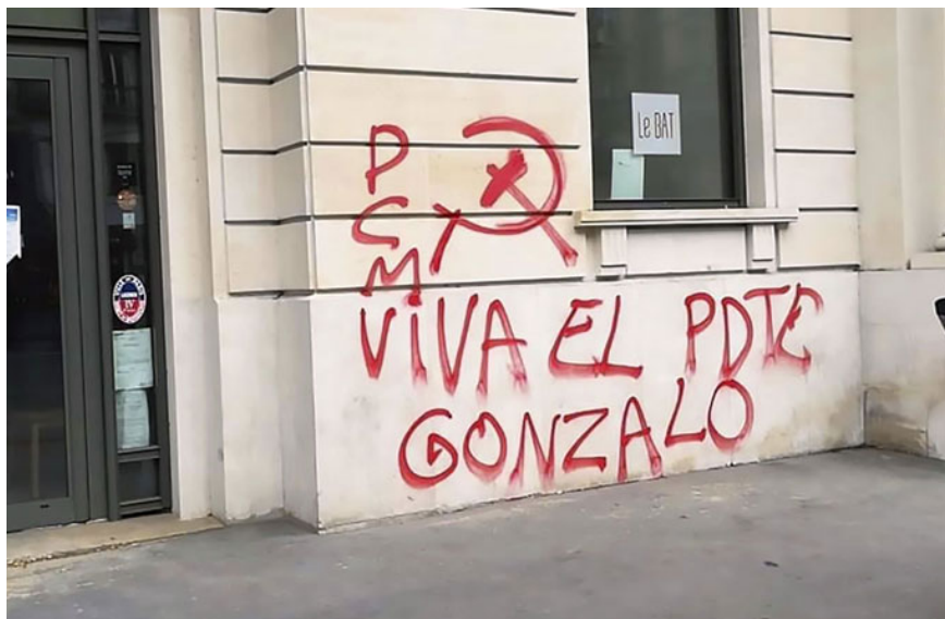
Maoísmo francés arenga por el ‘Presidente Gonzalo’

“Con 85 años recién cumplidos, Guzmán aún sigue incendiando los estantes con su pensamiento”, dice el articulista y señala que en una librería ubicada en la 58 Rue Gay-Lussac del V distrito de París, “se vende su flamante publicación bajo el sugerente título de À propos de cent-cinquante ans de Révolution Proletarienne Mondiale. ”