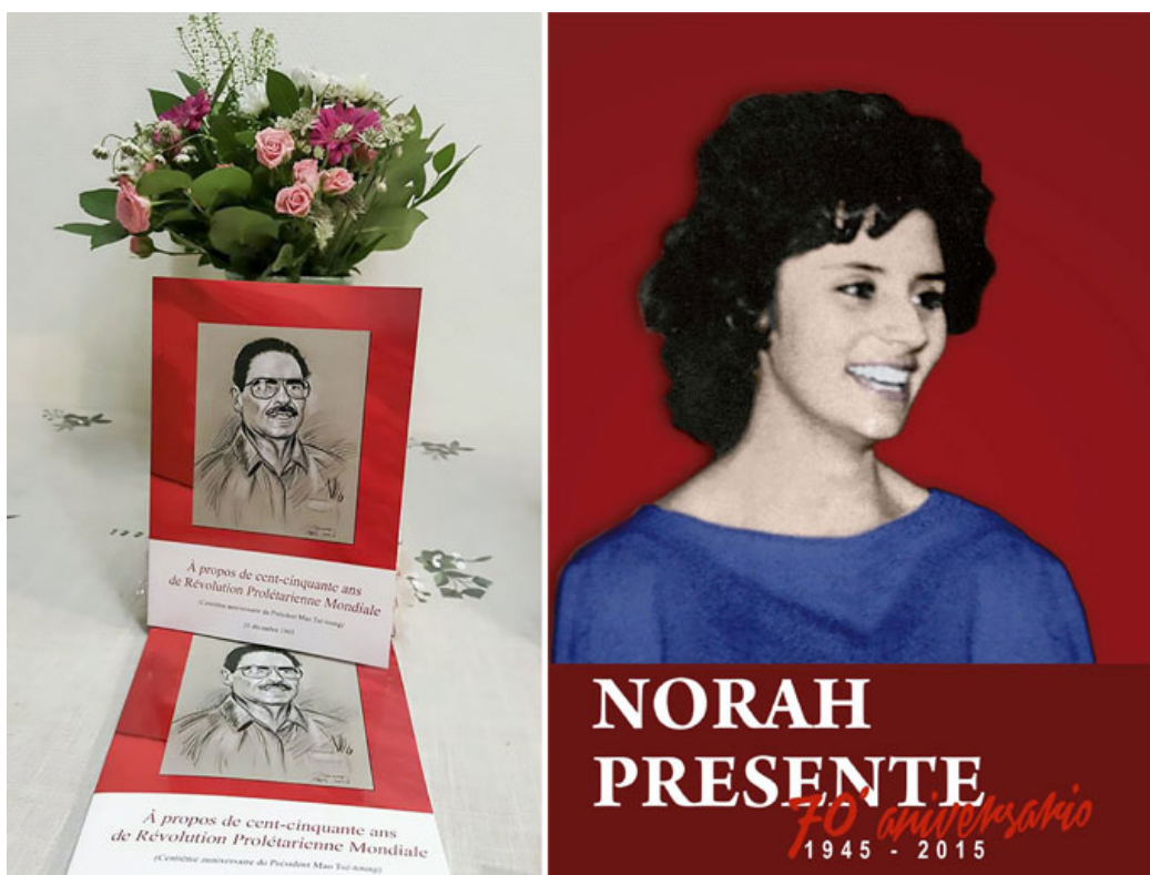
De venta en la librería parisina Le point du jour . También hay DVDs.

“La publicación principal, sin embargo, es À propos de cent-cinquante ans de Révolution Proletarienne Mondiale ,” se lee, y a modo de alerta —que no de publicidad— culmina: “Ojo: de los chalecos amarillos a las flores amarillas hay un paso”.